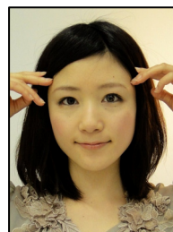
メールで自分の 写真を添付・送信